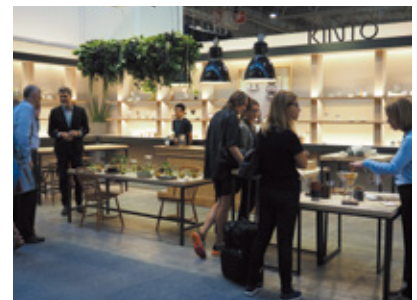
Maison & Objet, Sep 2016

Seattle, USA / Booth 2210 2017年4月20日 - 23日